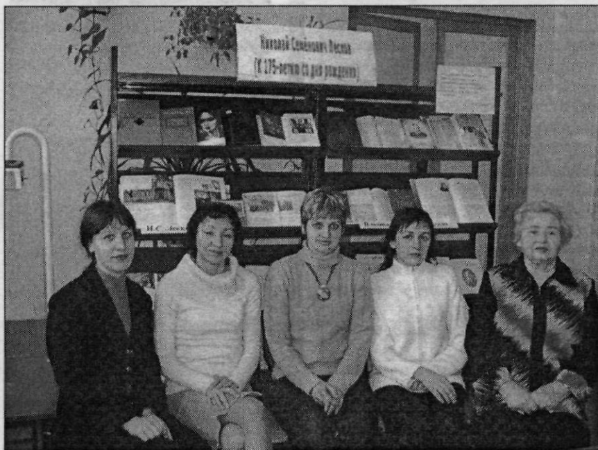
Участники литературно-художественной композиции «Орловские страницы Н. С. Лескова»

земляку, писателю, превосходно знавшему историю, быт и нравы родных мест, — Николаю Семеновичу Лескову.